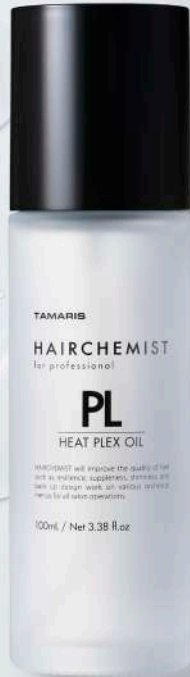
PL Oil texture