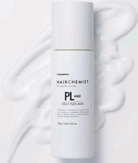
PL Milk texture